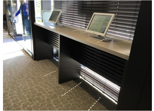
■特注カウンター/PC検索用

■N支店新築に伴い、特注家具一式を窓口商社より受注。店舗のトータルコーディネートの一環として、メラミン・ポリ合板、突板貼塗装仕上げ、人工大理石と塩ビシート、ステンレスと各種素材を使用した特注家具を製作しました。