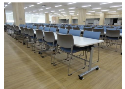
■イスが掛けられるフック付き