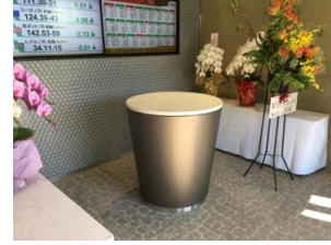
■特注ハイテーブル/人工大理石トップ