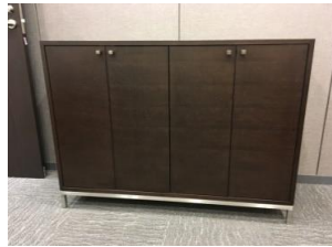
■特注クレデンザ/突板貼全面塗装

■N支店新築に伴い、特注家具一式を窓口商社より受注。店舗のトータルコーディネートの一環として、メラミン・ポリ合板、突板貼塗装仕上げ、人工大理石と塩ビシート、ステンレスと各種素材を使用した特注家具を製作しました。