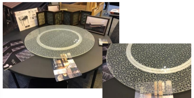
・ガラスターンテーブルが絹で華やかに変身