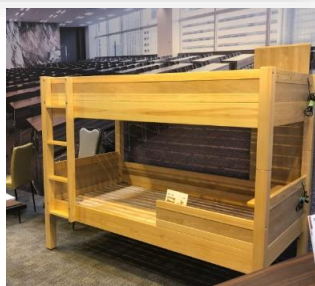
・ドミトリー向け木製二段ベッド