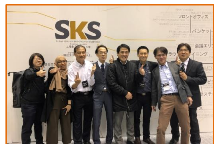
皆様 ご来場ありがとうございました

←カンファレンステーブルのミニチュア折畳み機構・特長をミニチュアでも見ていただきました