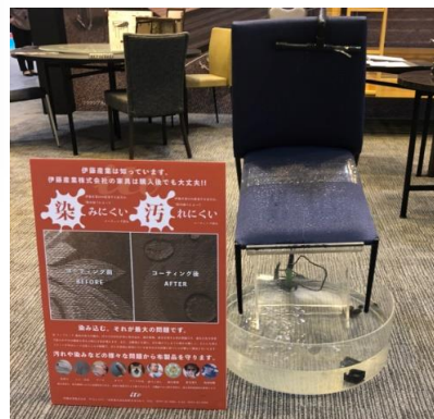
・撥水デモ 納入後のイスにも撥水加工できます