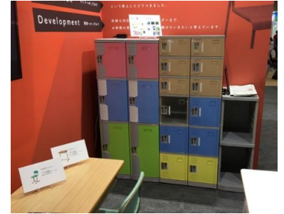
プラロッカーも注目されました