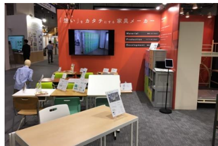
講義机KJ型 学生机KS型&学生イス エディ