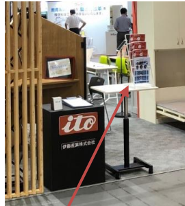
コーティング紹介