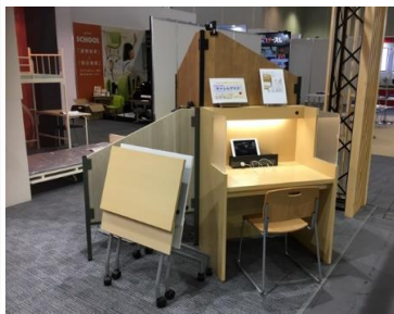
講義机KF型 キャレルデスク