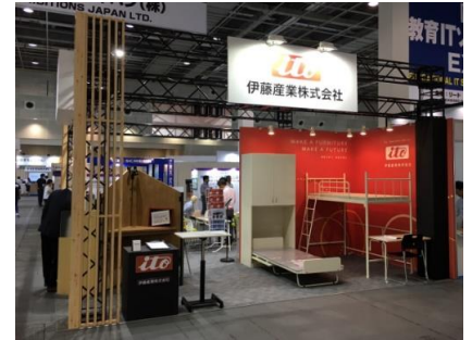
■皆様 ご来場ありがとうございました