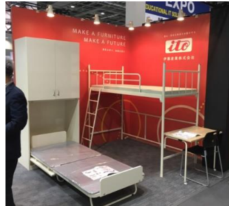
収納ベッド、ロフトベッド