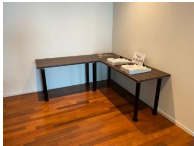
ビュッフェテーブル W1200,1800×D600 昇降脚