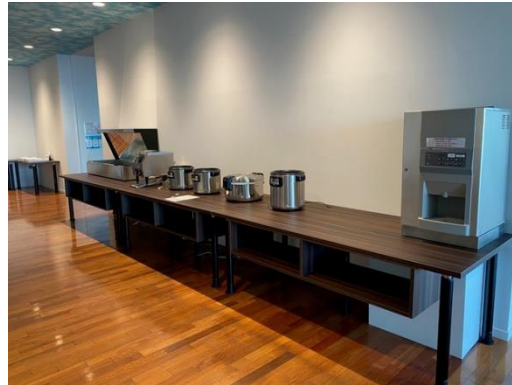
ビュッフェテーブル W2000×D900 3台 昇降脚、収納スペース付