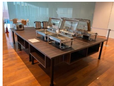
ビュッフェテーブル W2200×D1200,1100 3台 昇降脚、収納スペース付