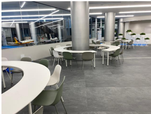
C型造作テーブル 3セット納入 柱を囲むように配置した。 天板裏には家具用コンセントを取り付けた。