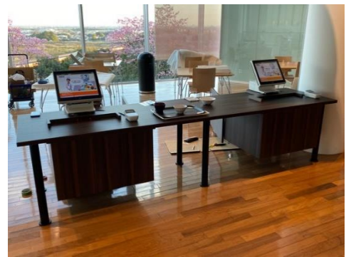
精算機台 W3000×D750 昇降脚、収納BOX付