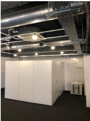
ローパーテーション