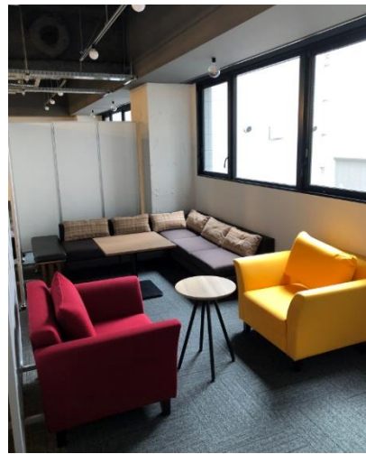
フリースペース／休憩コーナー