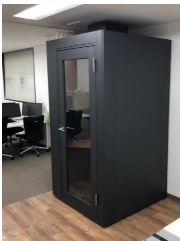
ワーキングブース