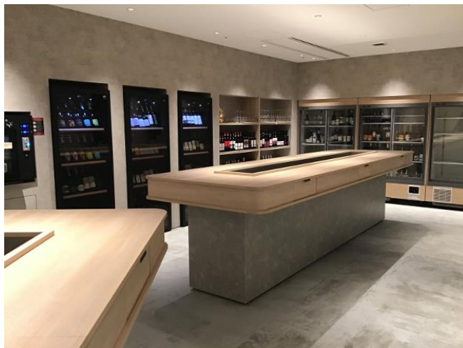
角打ちカウンター W4200×1200 抽斗6杯