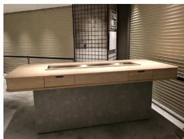
角打ちカウンター W2600×1200 抽斗4杯