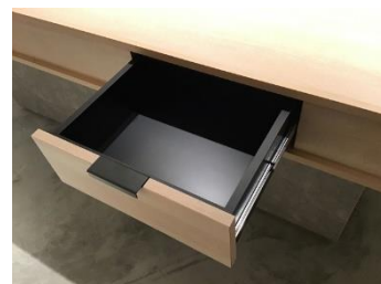
カトラリーを収納する抽斗

*角打ちとは？ 酒屋の店内において、その店で買った酒を飲むこと。またそれが出来る酒屋・立ち飲み屋のことを指します。角打ち発祥の地と言われる北九州地域において、工場や炭鉱、港湾等で働く労働者が、仕事帰りに酒屋で酒を飲んでいたことが「角打ち」として定着し、全国にその呼び方が定着していったと言われています。